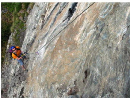
Gérard durante l'apertura di Rock Trip

Frequentando la parete durante i mesi caldi ci siamo accorti che è possibile arrampicare anche in estate dopo le 16.30.