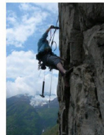
Piazzeno la sosta di Rock Trip

BUON DIVERTIMENTO Egon & C.o. (begon@bluewin.ch)